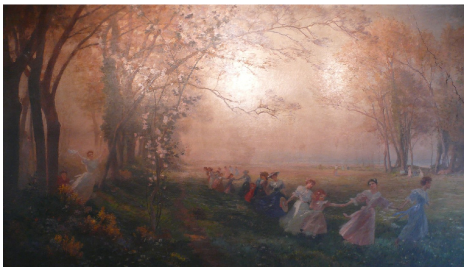
Ronde de jeunes filles ou Les Jeux de l'enfance et de la jeunesse, 1905

Licence du texte : CC-BY-SA-3.0 ; licence des images : domaine public